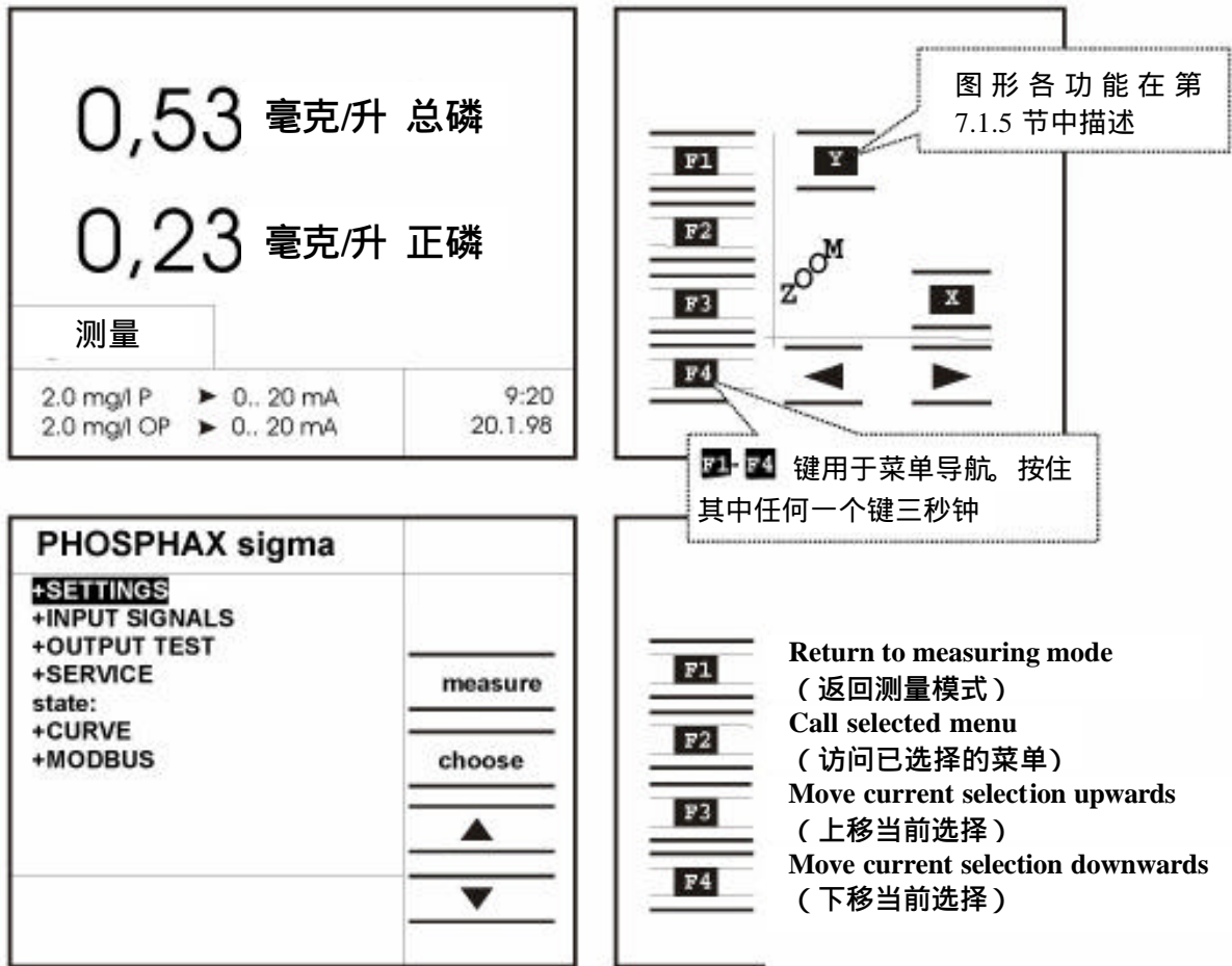
图 19 菜单系统